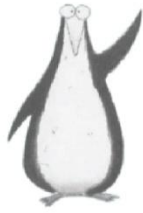
นกเพนกวิน